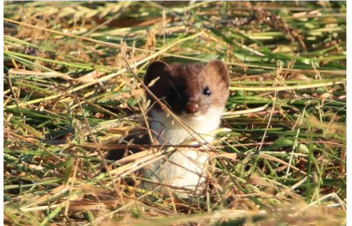
Hermelin, © M. Sinniger

Ort/Zeit: Gemeindesaal, Männedorf, 19:30 Uhr